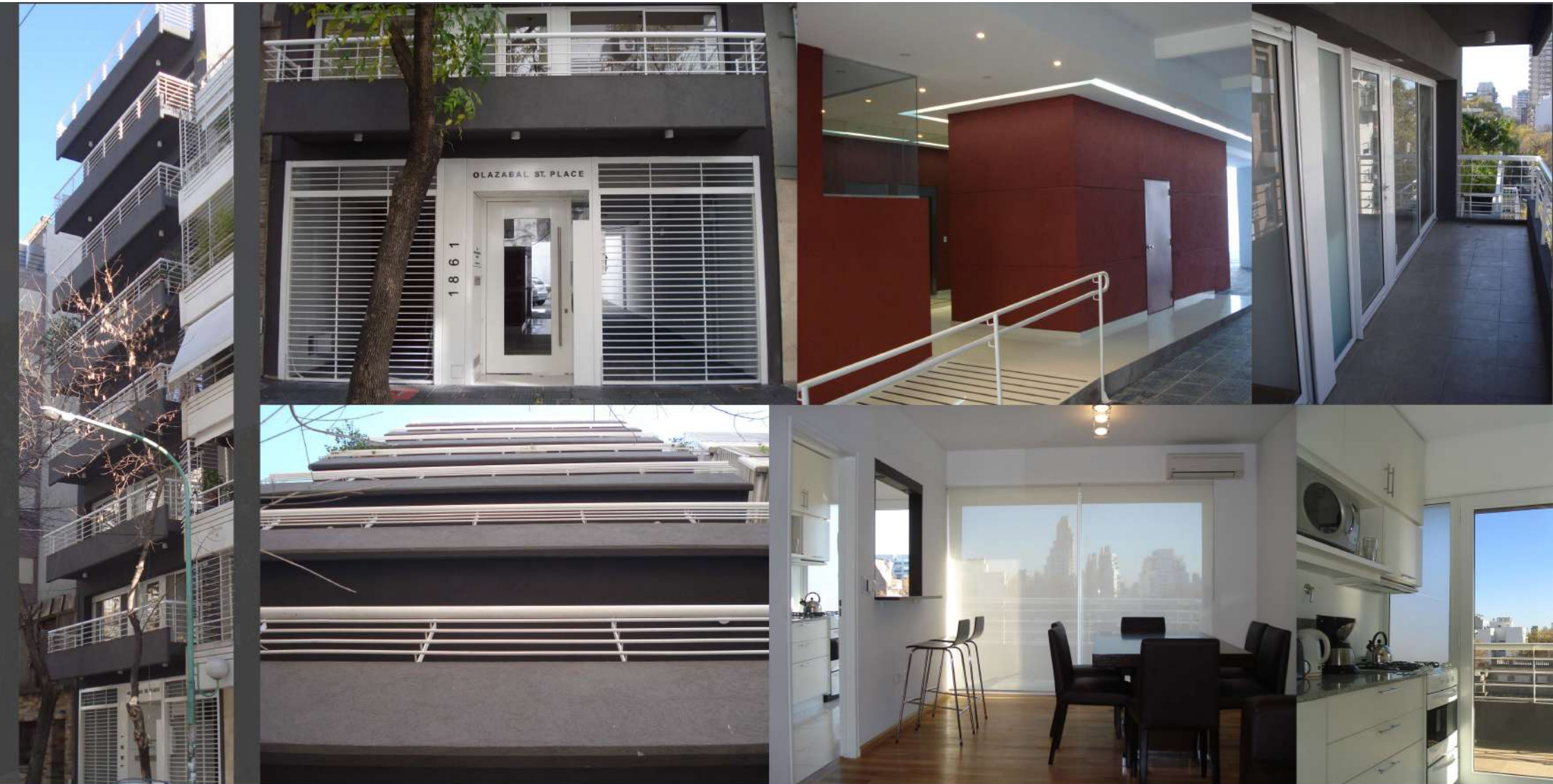
Olazabal 1861 Str. Place®.