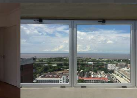
Gelly 3550. Piso 22.