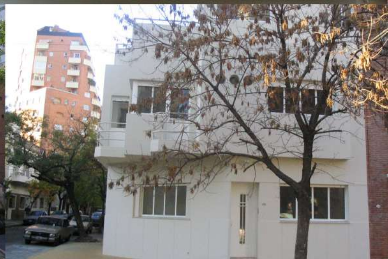
Ibera 2302 Str. Place®.