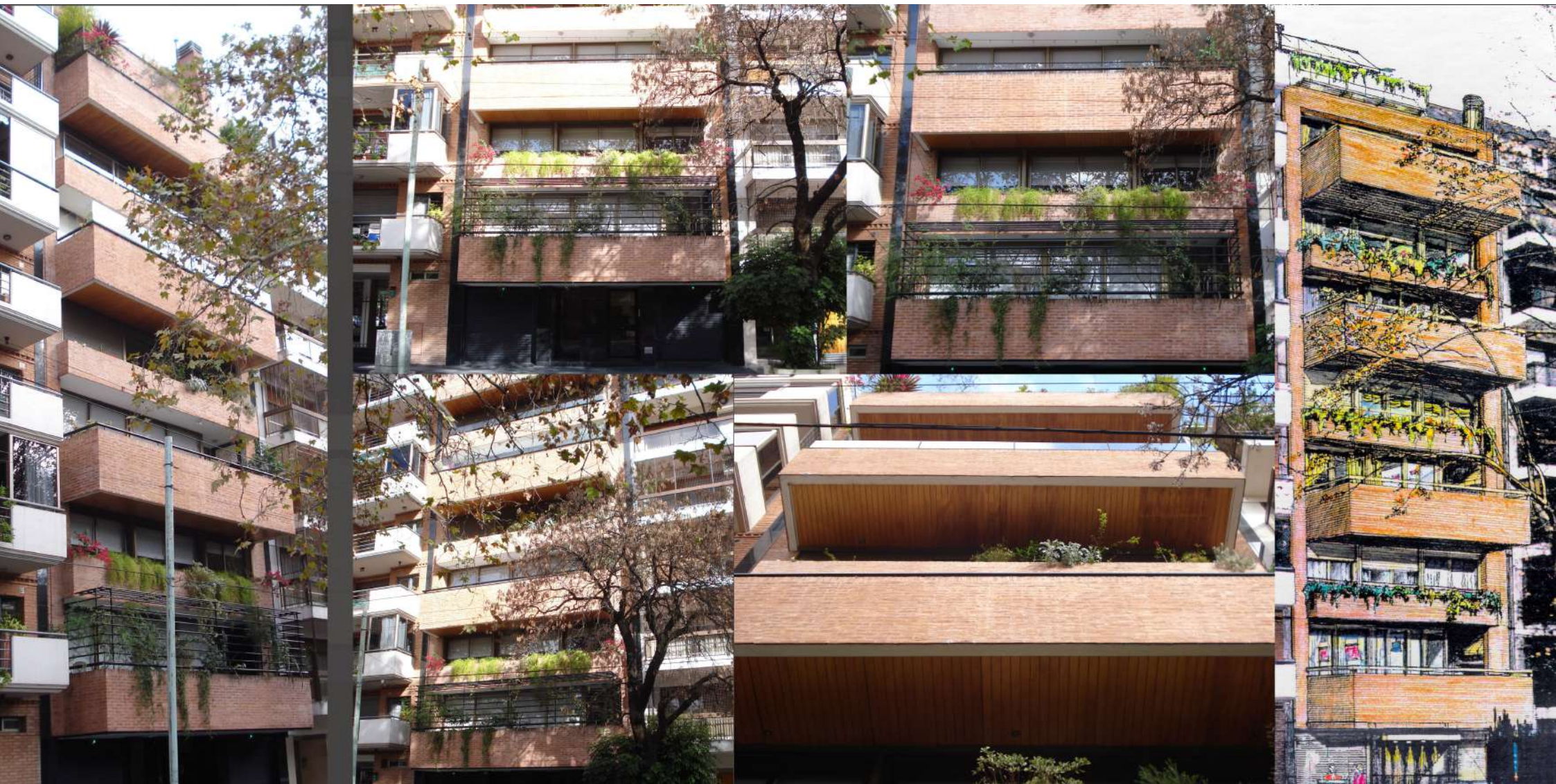
Arcos 1216 Str. Place®.